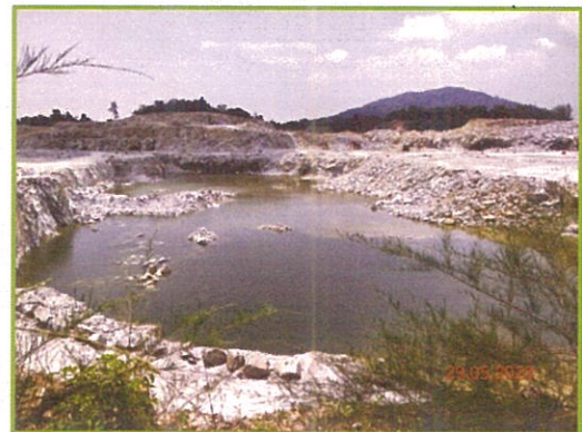
ภาพที่ 1-2 พื้นที่การทำเหมืองปัจจุบัน