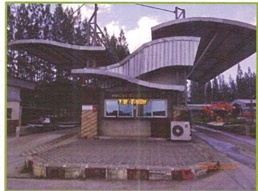
ภาพที่ 1-1 ห้างหุ้นส่วนจำกัด นราธิวาสโรงโม่หิน