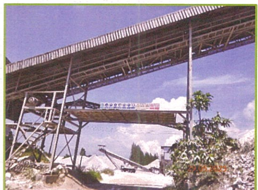
ภาพที่ 1-5 โรงโม่หินของโครงการ